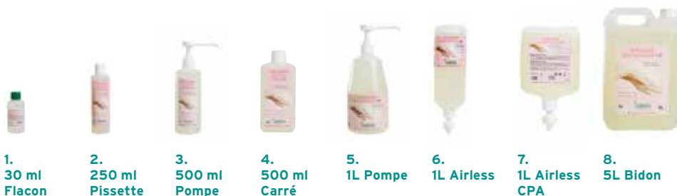
1. 30 ml Flacon 2. 250 ml Pissette 3. 500 ml Pompe 4. 500 ml Carré 5. 1L Pompe 6. 1L Airless 7. 1L Airless CPA 8. 5L Bidon

Solution lavante pour lavage simple des mains et de la peau pour un usage fréquent